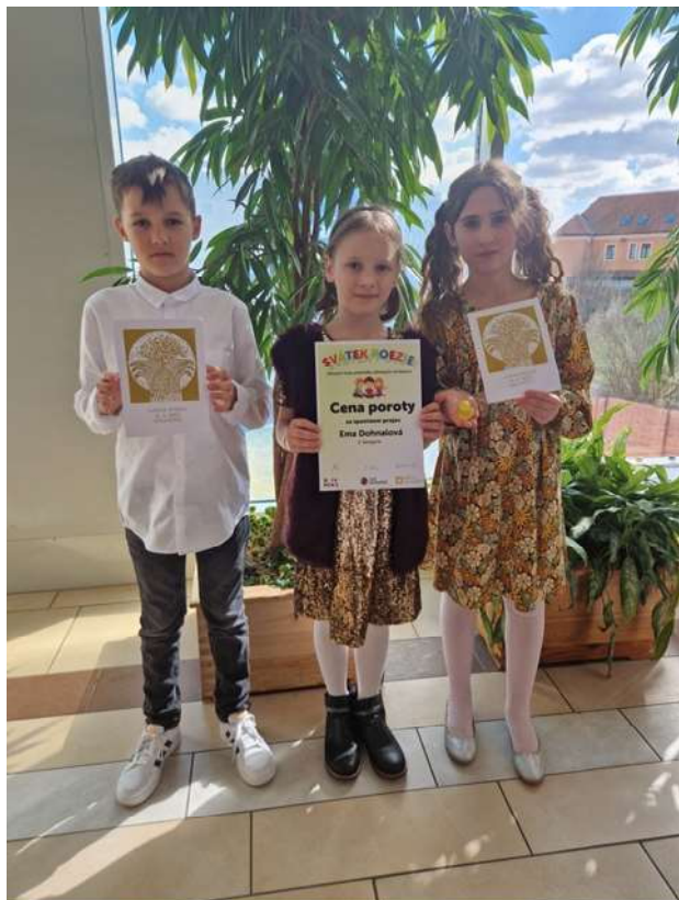
Reprezentanti za naši školu v přednesu